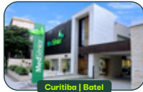
Curitiba | Batel