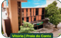
Vitória | Praia do Cento