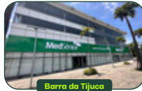
Barra da Tijuca