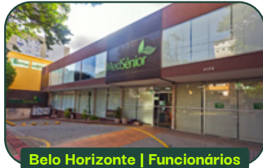
Belo Horizonte | Funcionários