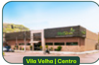
Vila Velha | Centro