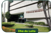
Ilha do Leite