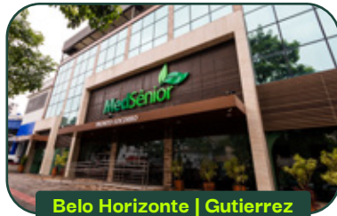
Belo Horizonte | Gutierrez