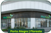
Porto Alegre | Floresta