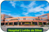
Hospital | Leitão da Silva