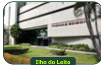
Ilha do Leite