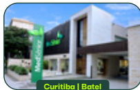
Curitiba | Batel