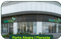
Porto Alegre | Floresta